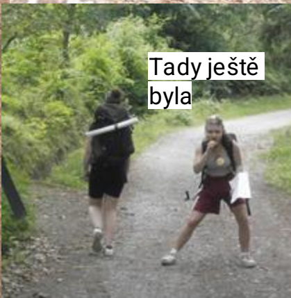
Tady ještě byla