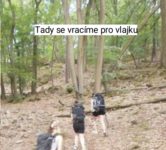
Tady se vracíme pro vlajku